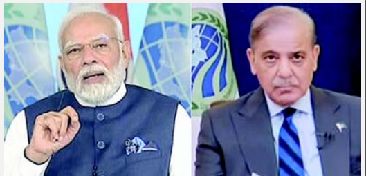
સંબંધો સુધારવા અપીલ

ભારત અને પાકિસ્તાનના ૧૦૦થી વધુ પ્રખ્યાત વ્યક્તિઓએ પીએમ મોદી અને પાકિસ્તાની સમકક્ષ શેહબાઝ શરીફને વાતચીત અને સામાન્ય દ્વિપક્ષીય સંબંધો પુનઃસ્થાપિત કરવા વિનંતી કરી છે, જેમાં હાઈ કમિશનરોને પુનઃસ્થાપિત કરવા, વિગ્ના સેવાઓ ફરી શરૂ કરવા અને એરસ્પેસ ફરીથી ખોલવાનો સમાવેશ થાય છે. આ પત્ર પર ભારતના ૬૧ અને પાકિસ્તાનના ૫૬ અગ્રણી વ્યક્તિઓએ હસ્તાક્ષર કર્યાં હતાં.