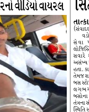
(સંવાદદાતા દ્વારા) વડોદરા, તા. ૧ વડોદરા મ્યુનિસિપલ કોર્પોરેશન દ્વારા તાજેતરમાં શરૂ કરવામાં આવેલી ઈલેક્ટ્રિક બસ સેવાને લઈને વિવાદ સર્જાયો છે. દોડતી બસમાં ડ્રાઇવર સ્ટિયરિંગ પર પૂરું ધ્યાન આપવાના બદલે મોબાઇલમાં રીલ બનાવતો હોવાનો વીડિયો સોશિયલ મીડિયામાં વાયરલ થતાં મુસાફરોની સુરક્ષા અંગે ગંભીર પ્રશ્ન ઊભા થયો છે. વાયરલ વીડિયોમાં ઈલેક્ટ્રિક બસનો ડ્રાઇવર બસ ચલાવતી વખતે મોબાઇલનો ઉપયોગ કરી રીલ બનાવતો જોવા મળ્યો છે. ડ્રાઇવરની આ બેદરકારીથી બસમાં મુસાફરી કરતા લોકોના જીવ જોખમમાં મુકાય છે.

લોખો લિટર પીવાનું પાણી વેડફાઈ રહ્યું છે. પાણીના સંચાલન અને જીઆઈએસ સિસ્ટમની કામગીરી અંગે હવે મહાનગરપાલિકાના આયોજન સામે ગંભીર સવાલો ઊભા થયા છે. લોખો લિટર પીવાનું પાણી વેડફાઈ રહ્યું છે. જાહેર પરિવહનમાં ડ્રાઇવરે વાહન ચલાવતી વખતે સંપૂર્ણ ધ્યાન માર્ગ પર રાખવું જરૂરી હોવા છતાં મોબાઇલનો ઉપયોગ કરવામાં આવતાં સુરક્ષા નિયમોના પાલન અંગે પ્રશ્ન ઊભા થયો છે. આજના સમયમાં સોશિયલ મીડિયાનું વધતું વળગણ લોકોને રીલ અને વાયરલ થવાની હોડ તરફ દોરી રહ્યું છે. કેટલાક લોકો અવનવા અભરત કરતા હોય છે, જેના કારણે ક્યારેક પોતાનો તો ક્યારેક બીજાના જીવ પણ જોખમમાં મુકાય છે.