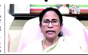
કોઈ પણ 'મા, માટી, માનુષ'ની મિલકત બળજબરીથી જત કરી શકતું નથી. આ પ્રતીક મારા દ્વારા આપવામાં આવ્યું હતું. ૨૦૨૬ની ચૂંટણીમાં હું તમારા નામમાં બે માટે સહી કરનાર હતી. ચૂંટણીના બે મહિનામાં તમે કેવી રીતે દેશદ્રોહી બન્યા? તેની કોઈ મર્યાદા હોવી જોઈએ. તમે

(એજન્સી) તા.૪ મમતા બેનરજીએ કહ્યું કે તુણમૂલનું પ્રતીક તેમના વફાદાર જૂથ પાસે રહેશે, જે દર્શાવે છે કે બળવામોરોને લાંબી કાનૂની લડાઈનો સામનો કરવો પડી શકે છે. મમતા બેનરજીએ દાવો કર્યો હતો કે દબાણને કારણે બળવામોરો અલગ થઈ