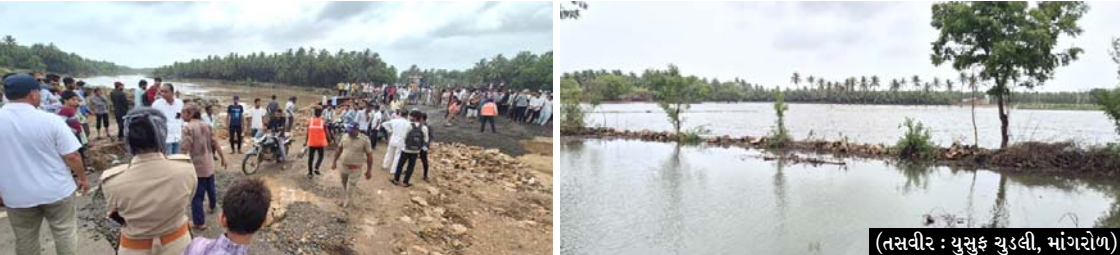
(તસવીર : યુસુક યુડી, માંગરોળ)

જમીયત ઉલ્મા-એ-હીન્દ, ઘાંચી સમાજ સહિતની સામાજિક સંસ્થાઓ અને માંગરોળની દિલેર જનતાએ મોડી રાત સુધી તનતોડ મહેનત કરી હજારો લોકોની મદદ કરી માનવતા મહેકાવી હતી