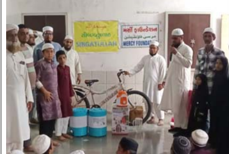
સહિતના વિવિધ વિસ્તારોના કુલ ૧૫૬ બાળકોએ સતત ૪૦ દિવસ સુધી નિયમિત અમલ કરીને ઉત્ક્રાંતિભરે ભાગ લીધો હતો. કાર્યક્રમના અંતે શ્રેષ્ઠ પ્રદર્શન કરનાર બાળકોને આકર્ષક ઈનામો આપી સન્માનિત કરવામાં આવ્યા હતા.

(સંવાદદાતા દ્વારા) આણંદ, તા. ૩ બાળકોના જીવનમાં ઈસ્લામી મૂલ્યો, સારા સંસ્કારો અને ઉત્તમ ચારિત્ર્યનું સિંચન થાય તેમજ તેઓ સિબગતુલ્લાહને પોતાના જીવનમાં અપનાવીને દીન અને દુનિયામાં સફળતા પ્રાપ્ત કરે તેવા ઉદ્દેશ્ય સાથે મર્સી ફાઉન્ડેશન, આણંદના સહયોગથી 'સિબગતુલ્લાહ' કાર્યક્રમનું સફળ આયોજન કરવામાં આવ્યું હતું. કાર્યક્રમનો મુખ્ય હેતુ બાળકોમાં સારા ગુણો, દીની ઈલ્મ, અકાઈફ, અખલાક, સંસ્કારો, પાંચ વેળાની નમાઝની પાઠ દી, રાત-દિવસ સારા માહોલમાં રહેવાની ટેવ, સત્ય બોલવાની પ્રેરણા, નિંદા-સુગલીથી દૂર રહેવું, નશો, તમાકુ અને અન્ય વ્યસનોથી બચવું, ગંધા-ત્વરાચરથી દૂર રહેવું, માતા-પિતાની આજ્ઞાનું પાલન કરવું તેમજ શિક્ષકો અને ઉસ્તાદોનો આદર કરીને આદર્શ જીવન જીવવાની પ્રેરણા આપવાનો હેતુ આ કાર્યક્રમમાં મસ્જિદે રાખીયા, મસ્જિદે યુસુક, મસ્જિદે ભેતુલ મુકરરમ, મસ્જિદે સ્વાહિલીન, મસ્જિદે ફાઝુકી, મસ્જિદે સહાબા, મરકજ મસ્જિદ, મસ્જિદે રેયાન, મસ્જિદે ફરહીન, પાકીડા મસ્જિદ, મસ્જિદે અમાર, પુલફાએ રાશીદીન, મસ્જિદે સહદ, બગદાદનગર, આંડલાવની મસ્જિદે કુશ તેમજ અમદાવાદ, દુધેશ્વર, સોજિત્રા