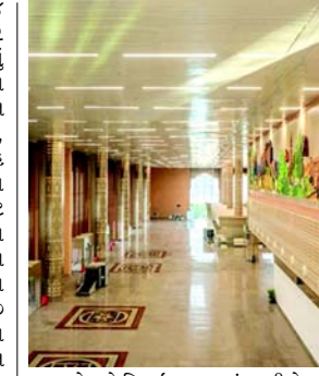
મુસાફરો માટે ડિઝાઇન કરવામાં આવી છે. આ ટર્મિનલ આધુનિક મુસાફરોની સુવિધાઓથી સજ્જ છે. રાજસ્થાનના શાહી વારસાથી પ્રેરિત, આ ટર્મિનલ પરંપરાગત તત્વો જેમ કે કમાનો અને ઝારોખાને સમકાલીન ડિઝાઇન સાથે મિશ્રિત છે. નવા ટર્મિનલની વડા પ્રધાનની મુલાકાત દરમિયાન લોક કલાકારોએ સંસ્કૃતિ પ્રદર્શન રજૂ કર્યા હતા.

(એજન્સી) જોધપુર, તા.૪ પ્રધાનમંત્રી નરેન્દ્ર મોદીએ શનિવારે જોધપુર એરપોર્ટ પર નવા ટર્મિનલ બિલ્ડિંગનું ઉદ્ઘાટન કર્યું અને સંશોધિત ઉડાન યોજનાનો શુભારંભ કર્યો હતો. મોદી જોધપુર પહોંચ્યા અને એરપોર્ટ પર રાજ્યપાલ હરિભાઉ બાગે, કેન્દ્રીય મંત્રી અને જોધપુરના સાંસદ ગજેન્દ્ર સિંહ શેખાવાત અને મુખ્યમંત્રી ભજનલાલ શર્માએ તેમનું સ્વાગત કર્યું હતું. વડાપ્રધાનએ રિમોટ બટન દબાવીને ઉદ્ઘાટન તકતીનું અનાવરણ કર્યું અને નવા ટર્મિનલ બિલ્ડિંગની મુલાકાત લીધી હતી. તેમણે સંશોધિત ઉડાન યોજના પણ શરૂ કરી છે. આગામી ૧૦ વર્ષમાં ૨૮,૮૪૦ કરોડ રૂપિયાની કાળવણી સાથે, આ યોજના ઉચ્ચત-સંચાલિત વિકાસના આગામી તબક્કાના આગળ વધારવા માટે છે. જોધપુર એરપોર્ટ પર નવી ટર્મિનલ ઇમારત કુલ રૂ.૪૮૦ કરોડના ખર્ચે બનાવવામાં આવી છે. રૂ.૩,૦૦૦ ચોરસ મીટરથી વધુ વિસ્તારમાં વાર્ષિક ૨૦ લાખ