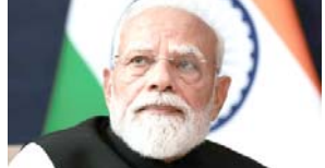
સંજોગોની તપાસ કરી રહ્યા છે. અધિકારીઓ એ પણ મુલ્યાંકન કરી રહ્યા છે કે શું કોઈ યુનો આચરવામાં આવ્યો છે. ઓસ્ટ્રેલિયાન ફેરરલ પોલીસે હજુ સુધી તપાસ પર જાહેરમાં ટિપ્પણી કરી નથી. ઓસ્ટ્રેલિયાન કાયદા અમલીકરણ એજન્સીઓ દ્વારા સરકારના વડાઓને નિર્દેશિત ધમકીઓને અવંત ગંભીરતાથી લેવામાં આવે છે. હાઈ-પ્રોફાઇલ આંતરરાષ્ટ્રીય મુલાકાતો માટે સુરક્ષા વ્યવસ્થામાં સામાન્ય રીતે ઓસ્ટ્રેલિયાન ફેરરલ પોલીસ, રાજ્ય પોલીસ અને નિષ્ઠાતર રક્ષણાત્મક સુરક્ષા એકમો સહિત અનેક એજન્સીઓ સામેલ હોય છે. આ કથિત ધમકી મોદીની ઓસ્ટ્રેલિયાની સત્તાવાર મુલાકાતના થોડા દિવસો પહેલા આપવામાં આવી છે, જ્યાં તેઓ મેલબોર્ન સહિત વિવિધ કાર્યક્રમો તેમજ સમુદાય કાર્યક્રમોમાં ભાગ લેશે તેવી અપેક્ષા છે.

(એજન્સી) તા. ૪ ઓસ્ટ્રેલિયાન ફેરરલ પોલીસ ૮ જુલાઈના રોજ મેલબોર્નની મોદીની નિર્ધારિત મુલાકાતના થોડા દિવસો પહેલા વડાપ્રધાન નરેન્દ્ર મોદીને લક્ષ્ય બનાવતી ઓનલાઈન ધમકી મારી નાખવાની ધમકીની તપાસ કરી રહી છે. અહેવાલોમાં જણાવવાનું છે કે તપાસકર્તાઓએ સાંશિયલ મીડિયા પોસ્ટ સાથે જોડાયેલ એક IP સરનામું ઓળખી કાઢ્યું છે. ધમકીઓમાં મોદીને અહેવાલ મુજબ, વડાપ્રધાનની ઓસ્ટ્રેલિયા મુલાકાત દરમિયાન ૮ જુલાઈના રોજ મેલબોર્નના મોર્વલ સ્ટેડિયમમાં યોજાનાર 'કેમ્બેરીન' ની માટે 'ક્રોમ્યુનિટી ઈવેન્ટનો પ્રચાર' કરવાની કેસબુક પોસ્ટ હેઠળ આ ધમકી આપવામાં આવી હતી.