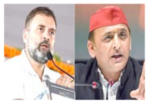
મતવિસ્તારોની ઓળખ કરવાનું શરૂ કરી દીધું છે જ્યાં તે ગઠબંધન વાટાઘાટો દરમિયાન વિચરતનીય દાવો કરી શકે છે. આ કવાયત એક વ્યાવસાયિક એજન્સીની મદદથી હાથ ધરવામાં આવી રહી છે જે મુલ્યાંકન કરી રહી છે અને મતદાન પેટર્નનું વિશ્લેષણ કરી રહી છે. કોંગ્રેસના એક વરિષ્ઠ વ્યૂહરચનાકારે જણાવ્યું હતું કે, પાર્ટીનું વાસ્તવિક લક્ષ્ય ૧૨૦થી ૧૩૦ બેઠકો વચ્ચે ચૂંટણી લડવાનું છે. કોંગ્રેસ એક જુનિયર ભાગીદાર તરીકે વાટાઘાટ કરવા માંગતી નથી. આ વિચાર સમાનતાની સ્થિતિથી વાટાઘાટો કરવાનો છે અને આ પગલાથી સપાને અસરથી થવાની શક્યતા છે. ૨૦૨૪ની લોકસભા ચૂંટણીમાં કોંગ્રેસના સારા પ્રદર્શન છતાં સપા ઉત્તર પ્રદેશમાં મુખ્ય વિપક્ષી દળ રહ્યું છે અને