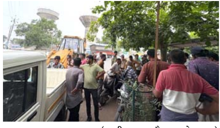
પતરાના શેડ તોડી પાડવામાં આવ્યા છે. ૧૨ જેટલા કેબીનો ઉપાડી લેવામાં આવ્યા છે અને ટ્રાફિક જામના પ્રશ્ન પણ ઉદ્ભવતા હોય છે ત્યારે ચાલુ વર્ષે આ પ્રકારના પ્રશ્નો ઉદ્ભવે નહીં તે અંગેના પ્રયત્ન મહાનગરપાલિકાએ હાથ ધર્યાં છે.

સુરેન્દ્રનગર, તા. ૪ સુરેન્દ્રનગર વઢવાણ રોડ ઉપર કરવામાં આવેલા પાકા દબાણો દૂર કરવા અંગેની કામગીરી મહાનગરપાલિકાની ટીમ દ્વારા હાથ ધરવામાં આવી છે. ત્રણ-ત્રણ વખત નોટિસ આપવામાં આવી હોવા છતાં પણ પાકા દબાણ હટાવવામાં ન આવ્યા હતા ત્યારે હવે તેની ઉપર મનપાએ બુલડોઝર ફેરવી નાખ્યું છે. સુરેન્દ્રનગરના ડી-માર્ટ ચરમાળિયા મંદિર લીંબડી રોડ તેમજ આજુબાજુના વઢવાણ સુરેન્દ્રનગર રોડ ઉપર કરવામાં આવેલા દબાણ દૂર કરવામાં આવ્યા છે જેમાં અલગ-અલગ ૨૮ જેટલા