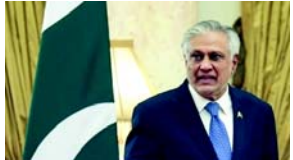
અમારી મુક્તિ માટે ૧૦૦,૦૦૦ ડોલરની માગણી કરવામાં આવી હતી: પાકિસ્તાનમાં ગેંગરેપની પીડિતાએ નાયબ વડાપ્રધાન ઇશાક દારના પૌત્ર પર આરોપ લગાવ્યો

(એજન્સી) તા.૪ પાકિસ્તાનમાં બે વિદેશી મહિલાઓના કથિત અપહરણ અને ગેંગરેપની તપાસમાં એક નવો વળાંક આવ્યો છે, તપાસકર્તાઓ પાકિસ્તાનના નાયબ વડાપ્રધાન અને વિદેશ પ્રધાન ઇશાક દારના સંબંધીને સંડોવતા કેસના ભાગ રૂપે સંભવિત ક્રિપ્ટોકરન્સી વિવાદની તપાસ કરી રહ્યા છે. પીડિતો પૈકી એક, એસ્ટ્રિડ ગ્રેબિએલા ત્રિન્સન બ્રાચોએ ફોજદારી કાર્યવાહી સહિતા (CRPC)ની કલમ ૧૬૪ હેઠળ ન્યાયિક મેજિસ્ટ્રેટ સમક્ષ પોતાનું નિવેદન નોંધાવ્યા બાદ આ ઘટના બની છે, જેમાં આવરોપ લગાવવામાં આવ્યો છે કે મુખ્ય આરોપી, રઝા દાર તેની મુક્તિ માટે US $૧૦૦,૦૦૦ની માણસી કરી હતી. લાહોરમાં બે વિદેશી મહિલાઓ પર ગેંગરેપ કેસમાં મુખ્ય શંકાસ્પદ તરીકે તેમના પૌત્રની ધરપકડ થયા બાદ પાકિસ્તાનના નાયબ વડાપ્રધાન અને વિદેશ પ્રધાન ઇશાક દાર ટીકાનો સામનો કરી રહ્યા છે. પાકિસ્તાનના નાયબ વડાપ્રધાન અને વિદેશ પ્રધાન ઇશાક દારનો પૌત્ર ગેંગરેપ કેસમાં મુખ્ય શંકાસ્પદ હોવાનું કહેવાય છે. ૨૯ જૂનના રોજ બે મહિલાઓ - એક વેનેઝુએલાની અને બીજી મદરલેન્ડની - પર