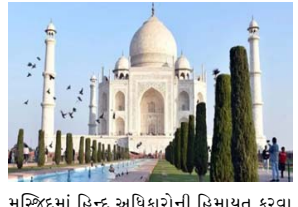
મસ્જિદમાં હિન્દુ અધિકારોની હિમાયત કરવા માટે પ્રખ્યાત છે. અરજી અનુસાર, તેજો મહાલય મંદિરનું નિર્માણ ૧૧૫૫-૫૬ એડીમાં રાજા પરમાદી દેવ દ્વારા કરવામાં આવ્યું હતું, પરંતુ ત્યારબાદ તેનું નિયંત્રણ રાજા માન સિંહ અને બાદમાં ૧૭મી સદીમાં અજમેરના રાજા જયસિંહને સોંપવામાં આવ્યું હતું. અરજીમાં દલીલ કરવામાં આવી છે કે આ સ્મારક શાહજહાં દ્વારા કબજે કરવામાં આવ્યું હતું, જેમણે પછી તેને તેમની પત્ની મુમતાઝ મહેલના સ્મારક તરીકે

(એજન્સી) તા. ૪ હાઈકોર્ટમાં દાખલ કરાયેલી અરજીમાં જણાવવાનું છે કે, આગ્રામાં વિશ્વ વિખ્યાત તાજમહેલ લાંબા સમયથી ભારતીય પર્યટનનું પ્રતીક છે, તેમાં ૧૦૯ પુરાતત્વીય વિશેષતાઓ હોવાનો આરોપ છે જે સુચવે છે કે તે પરંપર ભગવાન શિવને સમર્પિત હિન્દુ મંદિર 'તેજો મહાલય' હતું અને પાછળથી મુઘલ શાસક શાહજહાં દ્વારા તેને ઈસ્લામિક ઈમારતમાં રૂપાંતરિત કરવામાં આવ્યું હતું. આ અરજી આગ્રા કોર્ટના અગાઉના આદેશને પડકારતી દાખલ કરવામાં આવી હતી જેમાં તાજમહેલમાં હિન્દુ પ્રતીકોનો નકશો બનાવવા માટે નિરીક્ષણ, વીડિયોગ્રાફી અને ફોટોગ્રાફી કરવા માટે એડવાકેટ કમિશનરની નિમણૂક કરવાનો ઈન્કાર કરવામાં આવ્યો હતો. આ અરજી ભગવાન અજેશ્વર મહાદેવ નાગનાથેશ્વર વિરાજાનના દ્વારા મિત્ર વકીલ હરિ શંકર જેન દ્વારા દાખલ કરવામાં આવી છે. જૈન, વારાણસીની જ્ઞાનવાપી