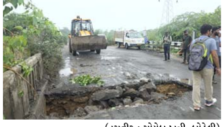
છે. સલામતીને પ્રાથમિકતા આપતાં તંત્રને પુલ સંપૂર્ણપણે બંધ કરી દીધો છે. પુલ બંધ થતાં નાના વાહનચાલકોને હવે આશરે છ કિલોમીટરનો સંપૂર્ણ ચકાસણી બાદ જ વાહનવ્યવહાર શરૂ કરવામાં આવે. હાલ લોકોમાં એક જ સવાલ ચર્ચાનો વિષય બન્યો છે કે બોડેલીનો ઓરસંગ નદીનો પુલ આખરે ક્યારે ફરીથી વાહનવ્યવહાર માટે ખુલ્લો મુકવામાં આવશે ?

બોડેલી, તા. ૪ બોડેલી શહેરને જોડતા ઓરસંગ નદીના પુલ પર મોટાસર ગામ તરફ અચાનક ગાબડું પડતાં તંત્ર દ્વારા સલામતીના ભાગરૂપે પુલ પરનો વાહનવ્યવહાર તાત્કાલિક અસરથી બંધ કરી દેવામાં આવ્યો છે. ઘટનાના પગલે સ્થાનિકોમાં ચિંતા ફેલાઈ ગઈ છે અને પુલ ક્યારે ફરી શરૂ થશે ? તે અંગે અનેક સવાલો ઊભા થયા છે. ઉલ્લાસનીય છે કે બે વર્ષ અગાઉ ગંભીરા પુલ ધુર્ધટના બાદ સલામતીને ધ્યાનમાં રાખી આ પુલ ભારે વાહનો માટે પહેલેથી જ બંધ કરવામાં આવ્યો હતો. હાલમાં છેલ્લા છ મહિનાથી પુલનું સમારકામ ચાલી રહ્યું છે. તે દરમિયાન જ પુલ પર ગાબડું પડતાં સમારકામની કામગીરી અને તેની ગુણવત્તા અંગે પણ ચર્ચા શરૂ થઈ છે. સ્થળ પર જોવા મળતી સ્થિતિ મુજબ પુલની પેરાક્રિટ (રિલિંગ) પણ જરૂરીત હાલતમાં છે, જેના કારણે અસ્થાનનો ભય વધી ગયો