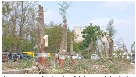
લોકોનો સવાલ છે કે, જે યોગ્ય આયોજન કરાયું હોત તો અનેક વૃક્ષો બચાવી શકાય તેમ હતું. અને પર્યાવરણ પ્રેમીઓએ ચેતવણી આપી કે, જે બાકી રહેલા વૃક્ષોને બચાવવા તંત્ર તાત્કાલિક યોગ્ય નિર્ણય નહીં લે અને માત્ર કાગળ પરના રિ-પ્લાન્ટેશનથી સંતોષ માનવામાં નહીં આવે. શહેરનો વિકાસ હરિયાળીનો ભોગ લઈને નહીં, પરંતુ પર્યાવરણનું સંતુલન જાળવીને થાય તેવી લોકમાન્ય વધુ પ્રબળ બની રહી છે.

પાલનપુર, તા. ૪ પાલનપુર શહેરના એરોમા સર્કલથી રેલવે બ્રિજ સુધી રૂા. ૧૮ કરોડના ખર્ચે નિર્માણધીન આઈકોનિક ૮-લેન માર્ગ માટે ૨૫થી ૩૦ વર્ષ જૂના વૃક્ષો કપાતાં પર્યાવરણપ્રેમીઓમાં ભારે રોષ ફેલાયો છે. વિકાસના નામે વર્ષો સુધી હજારો લોકોને છાંયો અને શુદ્ધ હવા આપનાર વૃક્ષોનો ભોગ લેવાઈ રહ્યો હોવાનું કહી પર્યાવરણપ્રેમીઓએ નિવાસી અધિક કલેક્ટરને આવેદનપત્ર પાડવી બાકી રહેલા વૃક્ષોને બચાવવાની માંગ કરી છે. કરોડો રૂપિયાના વિકાસકાર્યો વચ્ચે પર્યાવરણનું સંરક્ષણ જાળવવા તે માટે કોઈ ગંભીર આયોજન દેખાતું નથી, જેના કારણે તંત્રની કાર્યપદ્ધતિ સામે અનેક સવાલો ઊભા થયા છે. વિકાસ અને હરિયાળી વચ્ચે સંતુલન જાળવવાની જવાબદારી તંત્રની