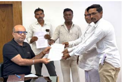
તળાવની જમીનમાં ગેરકાયદેસર વાવેતર કરવામાં આવતું હતું. ગેરકાયદેસર દબાણ અને સમતલીકરણના કારણે ચોમાસા દરમિયાન તળાવમાં વરસાદી પાણી આવવાનો કુદરતી રસ્તો અટકાવવા પો.ડી દેવામાં આવ્યા છે. તેમજ ટ્રેક્ટર દ્વારા જમીન સમતલ કરીને તળાવના ભાગને પૂરી દેવાનો પ્રયાસ કરવામાં આવ્યો છે. આ અંગે પણ આ ઈસમો દ્વારા

ડીસા, તા. ૪ ડીસા તાલુકાના આસેડા ગામના મુખ્ય જળ સ્ત્રોત સમાન સરકારી “લેબડીયું” તળાવની જમીન પર થઈ રહેલા ગેરકાયદેસર દબાણ અને ભોંપકામને તાત્કાલિક ધોરણે અટકાવવાની માંગ સાથે ગ્રામજનોએ ડીસા પ્રાંત કચેરી ખાતે નાયબ કલેક્ટરને આવેદન પત્ર સુપ્રત કર્યું હતું. ગ્રામજનોએ આશ્ચર્ય કર્યું છે કે સરકારી તળાવની જમીન પર દબાણ કરીને કુદરતી જળ પ્રવાહને રોકવાનો પ્રયાસ થઈ રહ્યો છે. સરકારી રેકોર્ડ પર નોંધાયેલા “લેબડીયું” તળાવમાં ગામના જ એક સ્થાનિક ઈસમ દ્વારા છેલ્લા ઘણા સમયથી ગેરકાયદેસર રીતે દબાણ કરવામાં આવી રહ્યું છે. તળાવની સરકારી જમીનમાં ગેરકાયદેસર રીતે સિમેન્ટના સંપૂર્ણપણે બંધ થઈ ગયો છે. તેમજ ટ્રેક્ટર દ્વારા જમીન સમતલ કરીને તળાવના ભાગને પૂરી દેવાનો પ્રયાસ કરવામાં આવ્યો છે. આ અંગે પણ આ ઈસમો દ્વારા