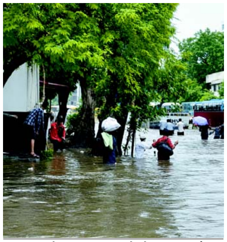
અમદાવાદ શહેરમાં પણ વરસાદ : ઠેર-ઠેર પાણી ભરાઈ ગયા

અમદાવાદ, તા. ૬ ગુજરાતના દક્ષિણ ગુજરાતમાં ભારેથી અતિભારે વરસાદની આગાહી વચ્ચે વલસાડ, સુરત અને નવસારીમાં ધોધમાર વરસાદ વરસ્યો છે. સુરતમાં બપોરે ૪ વાગ્યા બાદ બે કલાકમાં જ ચાર ઈંચ જેટલો વરસાદ પાબકતા રસ્તાઓ પર જળબંબાકારની સ્થિતિ જોવા મળી રહી છે. અનેક વિસ્તારોમાં સોસાપટ્ટી અને ટુકાનોમાં પાણી ઘૂસી જતા લોકો પરેશાન જોવા મળી રહ્યા છે. સાંજના સમયે ઓફિસથી પરત થવાના સમયે જ ધોધમાર વરસાદ વરસતા કર્મચારીઓને પણ ઘરે પહોંચવામાં મુશ્કેલી પડી રહી છે. સુરતના રાંદેર વિસ્તારમાં વીજકરંટ લાગતા બે યુવકોના મોત નિપજ્યા હોવાનું જાણવા મળ્યું છે. મહારાષ્ટ્રના પાલઘર નજીક ટ્રેક પર પાણી ભરાતા મુંબઈ રેલ વ્યવહાર ઠપ થયો છે, જેના કારણે કર્ણાવતી અને જોધપુર-બાંદરા જેવી મુખ્ય ટ્રેનોને વલસાડ અને વાપીથી જ પરત ફેરવવાની ફરજ પડી છે. હવામાન વિભાગ દ્વારા અત્યંત ભારે વરસાદની આગાહી સાથે ત્રણ જિલ્લા અને કેન્દ્રશાસિત પ્રદેશમાં 'રેડ એલર્ટ' જાહેર કરાયું છે. તો આજિલ્લામાં 'ઓરેન્જ એલર્ટ' અને સાત જિલ્લામાં ભારે વરસાદનું 'યેલો એલર્ટ' આપવામાં આવ્યું છે. સવારના ૬ થી ૧૪ વાગ્યા સુધીમાં ૫૦ તાલુકામાં વરસાદ નોંધાયો છે, જેમાં વલસાડના વાપીમાં ૪ ઈંચ વરસાદ પાબક્યો છે. સુરતમાં વીજળીના કડકા-ભકાક સાથે તૂટી પડેલા માત્ર એક કલાકના ધોધમાર વરસાદે સમગ્ર શહેરને ધમરોળી નાખ્યું છે, જેના કારણે અલ્પવાર્ષિક, કંતારગામ, વરાછા અને અડાજણ સહિતના