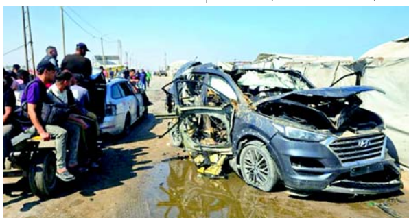
ધમકી આપી હતી. ● પેલેસ્ટીની કમિશને જણાવ્યું હતું કે ૨૦૨૬ના પહેલા ભાગમાં ઈઝરાયેલી ડ્રોન અને વસાહતીઓએ કબજા હેઠળના પશ્ચિમ કાંઠામાં ૧૧,૦૭૪ હુમલા કર્યાં છે. ગાઝાના આરોગ્ય

ઓછામાં ઓછા છ લોકો માર્યા ગયા છે અને ૨૦ ઘાયલ થયા છે. ● દક્ષિણ લેબેનોનમાં એક વાહન પર ઈઝરાયેલી ડ્રોન હુમલામાં ચાર લોકો માર્યા ગયા છે કારણ કે યુએસ સમર્થિત “યુદ્ધવિરામ”નું ઉલ્લંઘન ચાલુ છે. ● સંરક્ષણ પ્રધાન કાલો કહ્યું કે તેણે ઈઝરાયેલને “નાશ” કરવાની યોજના બનાવવા બદલ આયતુલ્લાહ ખામેનાઈની હત્યા કરી હતી અને ફરીથી ઈરાની નેતાઓને “નાશ” કરવાની