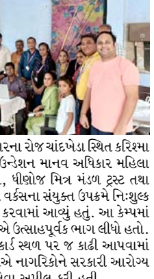
તા. ૦૫/૦૭/૨૦૨૬, રવિવારના રોજ ચાંદબેડા સ્થિત કરિશ્મા ફલેટ ખાતે યુનિયન રિવાઈવ કાઉન્સેલન માનવ અધિકાર મહિલા અને બાળ સશક્તિકરણ સંગઠન, ધીજોજ મિત્ર મંડળ ટ્રસ્ટ તથા ઉમેંગ સેવા ટ્રસ્ટ, એરોન ડિજિટલ વર્કસના સંયુક્ત ઉપક્રમે નિ:શુલ્ક આયુષ્માન કાર્ડ કેમ્પનું આયોજન કરવામાં આવ્યું હતું. આ કેમ્પમાં મોટી સંખ્યામાં સ્થાનિક નાગરિકોએ ઉત્સાહપૂર્વક ભાગ લીધો હતો. પાત્ર લાભાર્થીઓના આયુષ્માન કાર્ડ સ્થળ પર જ કાઢી આપવામાં આવ્યા હતા. આયોજક સંસ્થાઓએ નાગરિકોને સરકારી આરોગ્ય યોજનાઓનો વધુ લાભ લેવા અપીલ કરી હતી.

આ મનસ્વી નિર્ણયને લઈ ચૂંટાયેલા પ્રતિનિધિઓમાં નારાજગી (સંવાદદાતા દ્વારા) અમદાવાદ, તા.૬ અમદાવાદ રેલવે ડિવિઝન દ્વારા સ્થાનિક લોકપ્રતિનિધિઓની અવગણના કરીને ઉતાવળમાં મહત્વની અને મોટી કામગીરી થઈ રહી હોય ત્યારે સ્થાનિક જનપ્રતિનિધિઓને જાણ કેમ ન કરવામાં આવી? તેમણે રેલ વિભાગની આ મનમાનીને ગંભીરતાથી લઈને હવે કેન્દ્રીય સ્તરે ફરિયાદ કરવાનો નિર્ણય કર્યો છે. સાંસદ આ મામલે નિર્ણય વિભાગ અને DRM પાસે સત્તાવાર ખુલાસો માંગશે અને રેલ મંત્રી અશ્વિની વૈષ્ણવને રૂબરૂ મળીને આ અંગે ઉચ્ચ સ્તરીય રજૂઆત કરવામાં