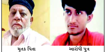
મૃતક પિતા આરોપી પુત્ર